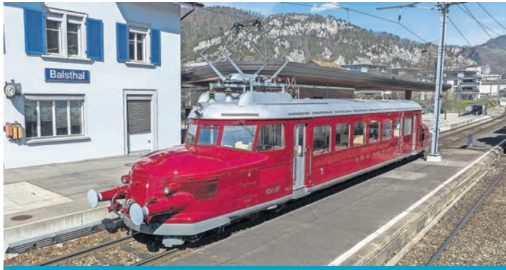
Neben dem ikonischen „Roten Pfeil“ (u.) bieten die Zugreisen von Maertens weitere nostalgische Schmankerl auf Schweizer Schienen.