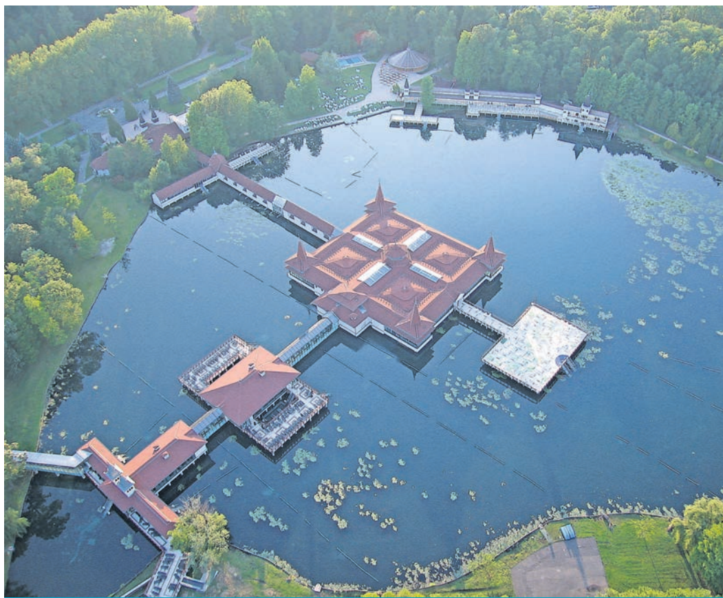
Im Thermalsee von Hévíz in Ungarn kann man das ganze Jahr über baden. Er wird von unterirdischen heißen Quellen gespeist.

• Halle 4, Stand D-11 Maertens – Meine Reisewelt GmbH Prohliser Allee 10, 01239 Dresden Telefon: 0351 – 56 39 39 30 www.maertens-reisen.de