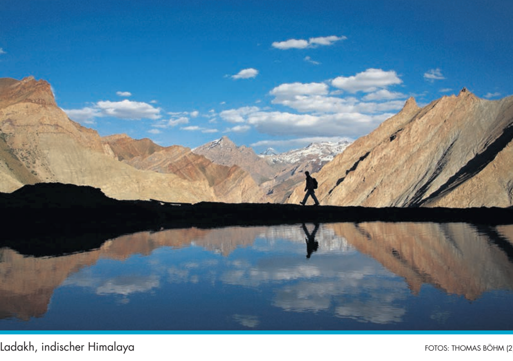
Ladakh, indischer Himalaya