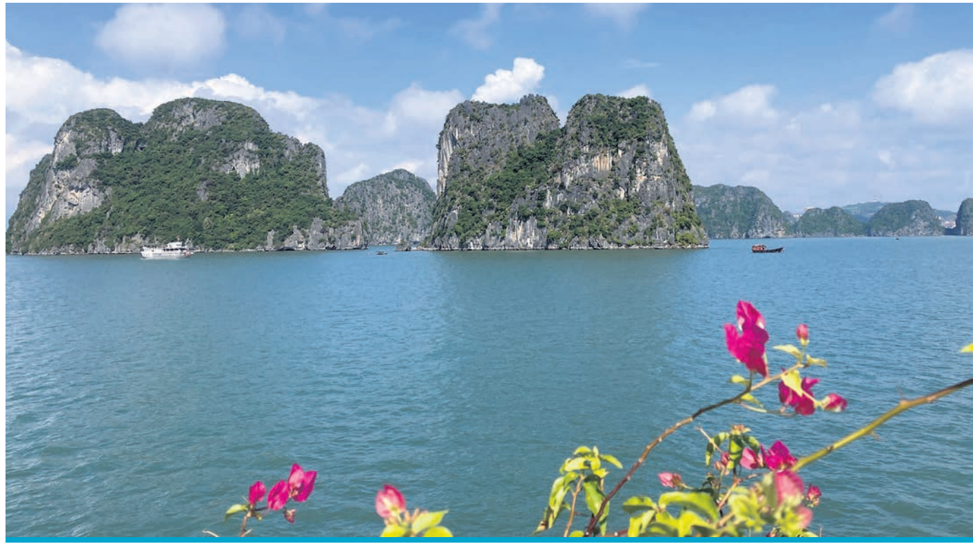
Kalksteininselchen in der weltberühmten Halong-Bucht

Ebenfalls im Norden liegt Vietnams Hauptstadt Hanoi, die sich