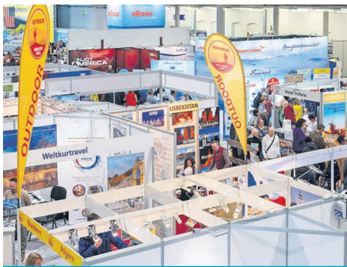
Große Vielfalt an Ausstellern in den Messehallen