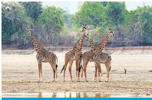
Im South Luangwa Nationalpark

Sambias bekannteste Attraktion liegt im Mosi-oa-Tunya Nationalpark, einem von insgesamt 20 solchen Schutzgebieten im Land. Während dieser Park eine 15-tägige Sambia-Reise von TARUK abschließend krönt, steht am Beginn der South Luangwa Nationalpark mit seinen Zebras, Giraf-