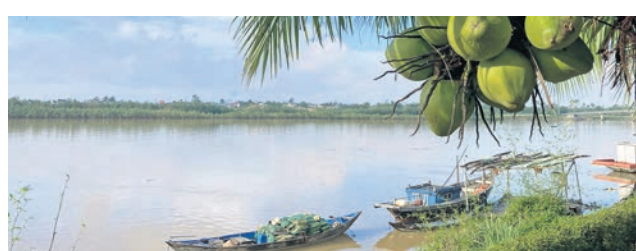
Bel Marina am Thu-Bon-Fluss in Vietnam

Viele verlockende Urlaubsangebote von sz-Reisen