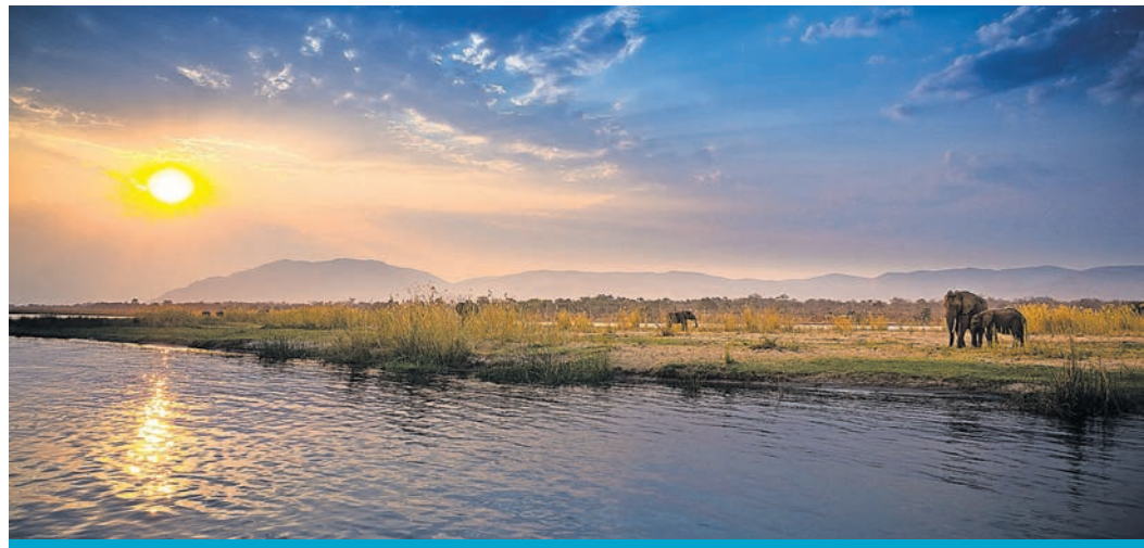
Am Ufer des Lower Zambezi