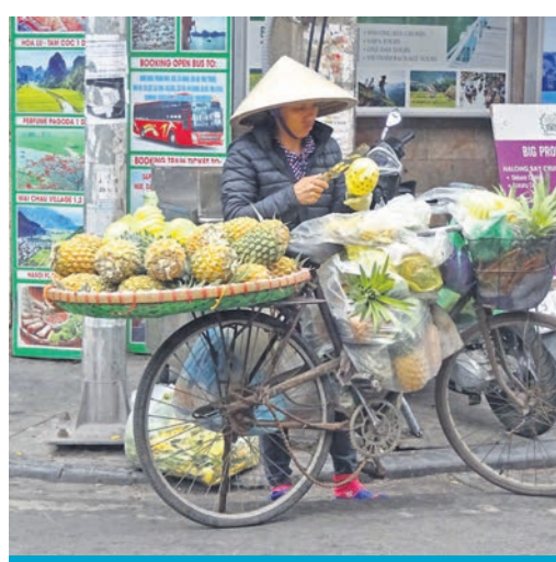
Alltagsleben in Hanoi und Vinh-Trang-Pagode in der Mekong-Delta-Region