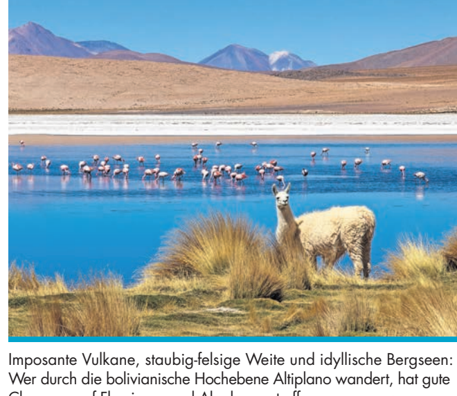
Imposante Vulkane, staubig-felsige Weite und idyllische Bergseen: Wer durch die bolivianische Hochebene Altiplano wandert, hat gute Chancen, auf Flamingos und Alpakas zu treffen.

Ebenso bunt wie die traditionellen Webstoffe der Aymara ist das Treiben auf den quirligen Straßen und Märkten von Santa Cruz oder La Paz. Eine bei Touristen besonders beliebte Kuriosität ist der Hexenmarkt von La Paz. Dort können magisch aufgeladene Steine, Figuren, Flöten und Pulver erworben werden. Ob sie den behaupteten Zweck erfüllen, ist fraglich, ein wunderbares Souvenir sind sie in jedem Fall. VIKTOR DALLMANN