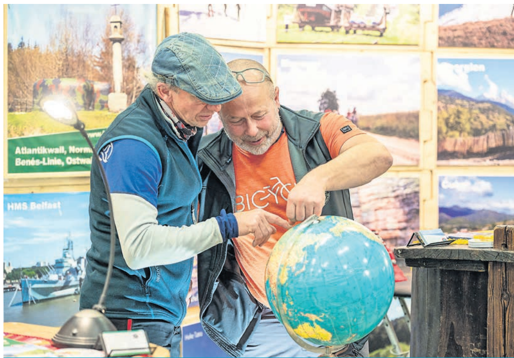
Auf der Reisemesse finden die Besucher Inspirationen und Angebote für Urlaube auf der ganzen Welt.

„Vom Kurztrip bis zur Fernreise wird die ganze Vielfalt des Reisens gezeigt“, heißt es beim Messe-