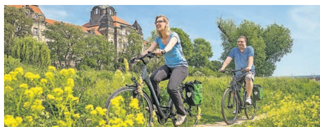
Unterwegs auf dem Elberadweg

Unvergessliche Aktivtouren mit Gepäcktransport